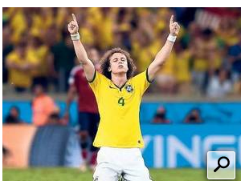
Messe auf dem Platz.

Wie entscheidend ist im Halbfinale der Heimvorteil für Brasilien? Wie wichtig sind Coolness und Leidenschaft? Und was bedeutet der Ausfall von Neymar für die Nationalelf? Der Mentaltrainer Steffen Kirchner im Interview.