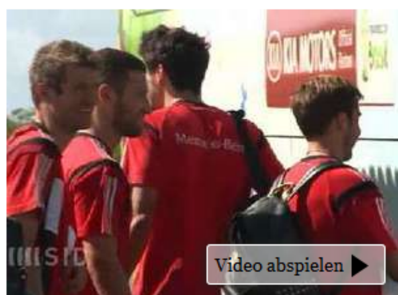
SPORT | 07.07.2014 | 2:10 MIN DFB-Elf bereit für Halbfinale: Bloß kein Spiel um Platz drei